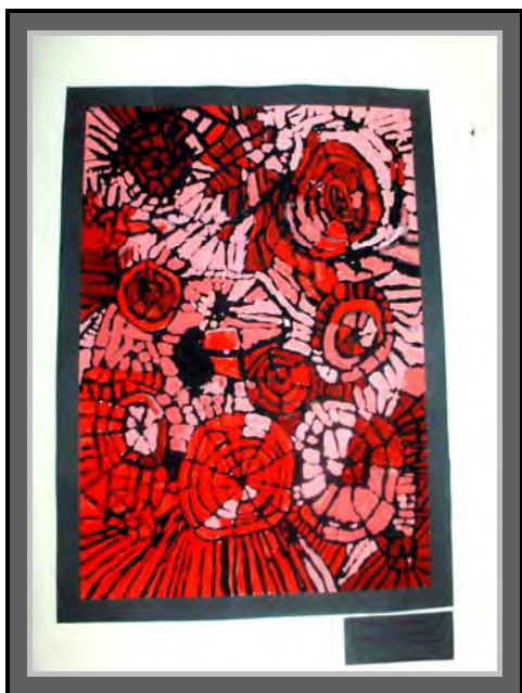
„Paukova mreža“, 11 mj. 2008. Slikanje mokrim bojama - tempera Odgojna skupina: Zlatne ribice, 6 g.