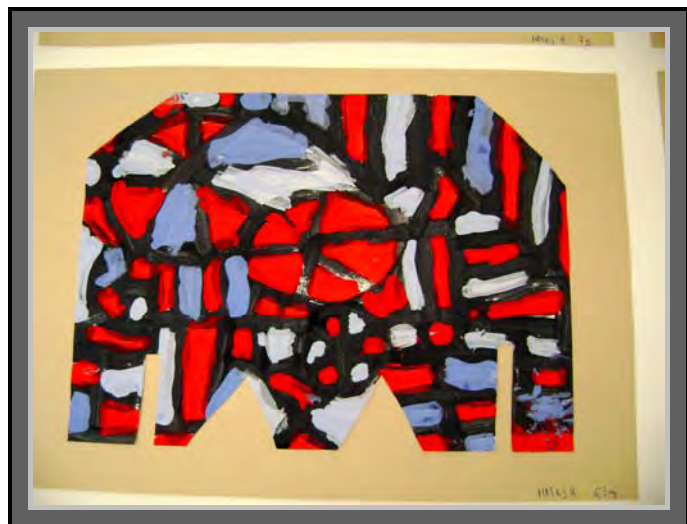
„Kompozicija“, slikanje – tempera , Matej 6, 3 g