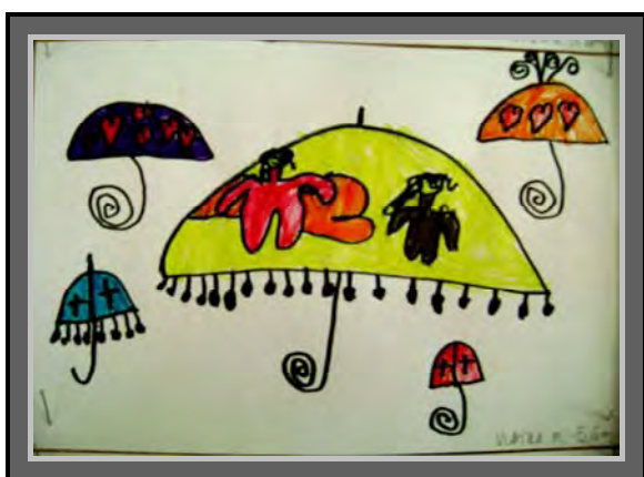
„Kišobran“, slikanje suhim bojama - tempera Vlatka 5,6g

Prva organizirana nastava risanja javlja se u Zagrebu 1786. godine. Josip II organizirao je nedjeljne škole za zidare, klesare i stolare. Risanje kao obrazovni predmet uveden je u naše škole u XIX. Stoljeću. Prva javna izložba dječjih likovnih radova održana je u umjetničkom paviljonu u Zagrebu 1904. godine pod nazivom „Umjetnost u životu djeteta“.