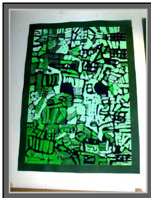
„Gradske ulice“, 12 mj. 2008. Slikanje mokrim bojama - tempera Odgojna skupina: Ježići, 6g.