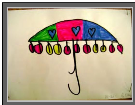
Kišobran, slikanje suhim bojama-tempera Petra 6,10 g