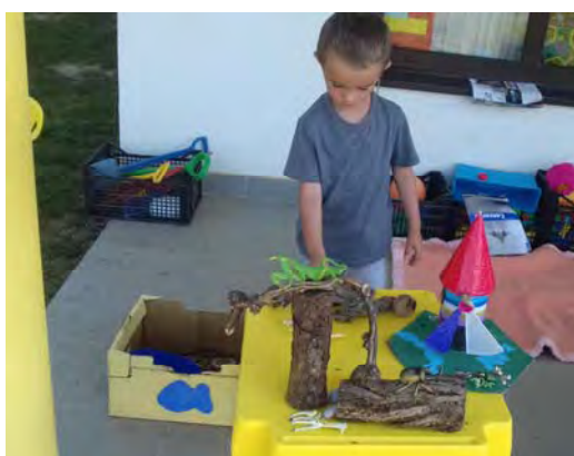
Igra prirodnim materijalima i gumenim kukcima (poticanje kreativnost)

Smatramo se odgovornima omogućiti djeci kvalitetno organiziran boravak na otvorenom budući da je igra na zraku tjelesno zahtjevnija od igre u zatvorenom. Potvrđeno je da pri boravak na zraku izuzev tjelesnog zdravlja, količina igre na zelenilu potiče razinu kognitivnog funkcioniranja djeteta ( Wells, 2000.)