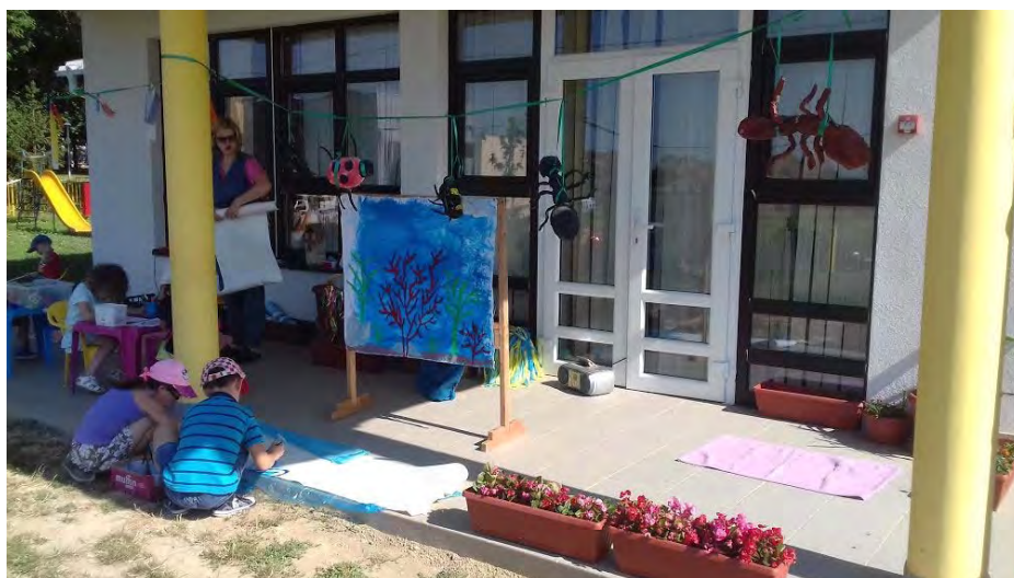
Likovne aktivnosti, tehnika tempera, motiv- „ more „