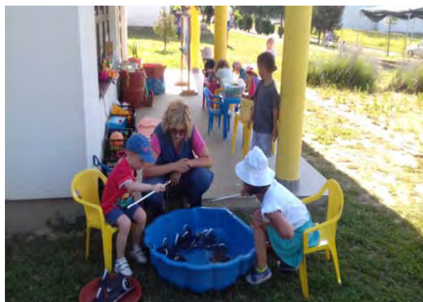
Tko će uloviti više ribica (vježba preciznosti i mat. vještina)