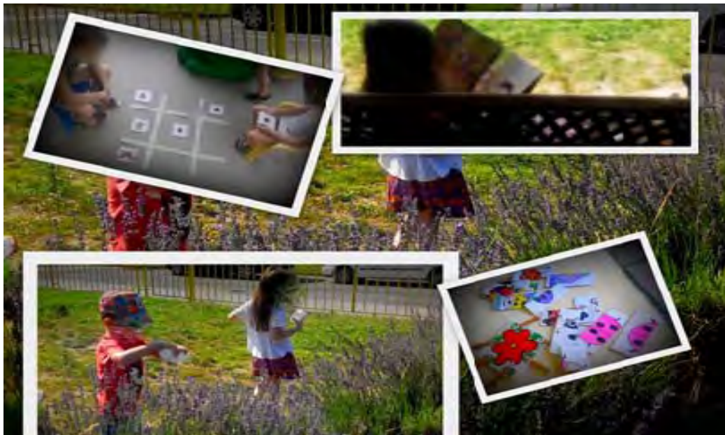
Lavanda u našem dvorištu-istraživanje osjetilima, istraživanje lavande i kukaca, ljetne slagarice –pridruživanje broja, i memori s ljetnim motivima