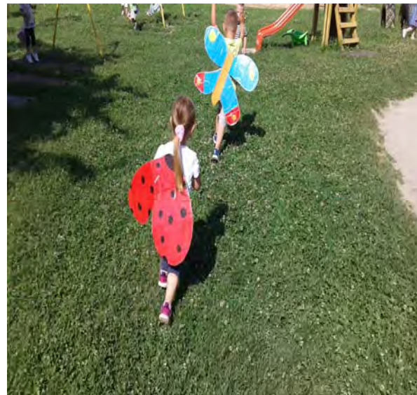
Pokretna igra leptirić i bubamara